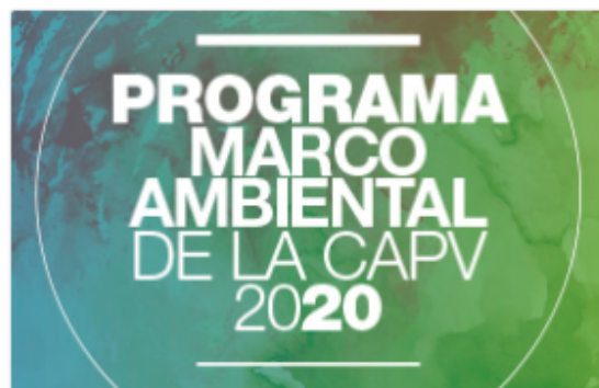
Programa marco ambiental