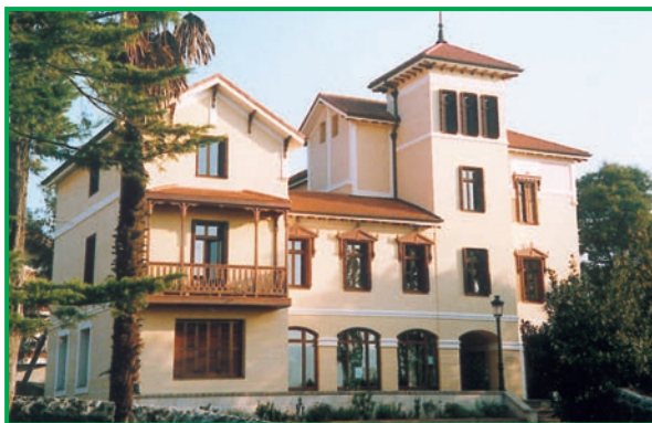
Urdaibaiko Patronatuaren egoitza Gernikan.