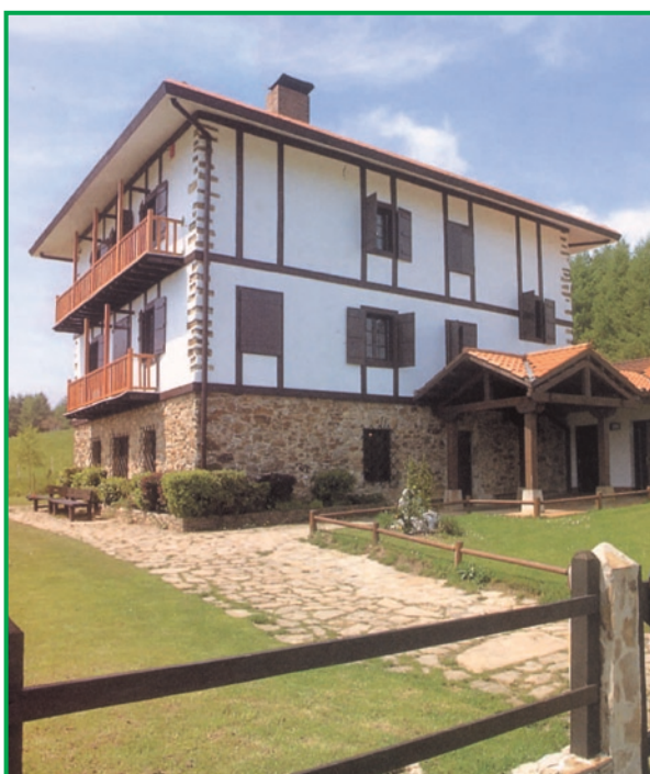
Toki-Alai. Urkiolako Parkeko Harrera, Argibide eta Azalpen lekua. Patronatuaren egoitza.

GUNE BABESTUEN KUDEAKETAREN erronka handia inguruan bizi diren pertsonen interesak, inguru-nearen babesa eta erabilera jostagarriak orekatztea da.