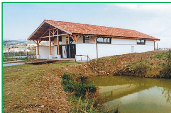
Txingudi ekoetxea. Plaiaundiko parkean.