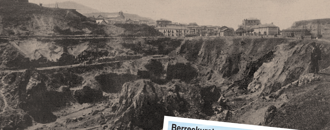
Lurrazaleko meategia La Arboledan Mina a cielo abierto en La Arboleda