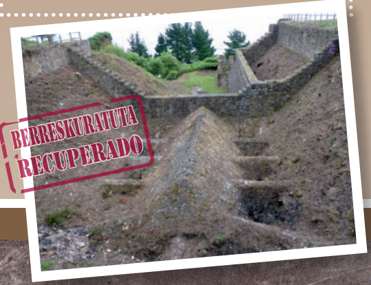
La Arboledako meatze ospitalea Hospital minero de La Arboleda