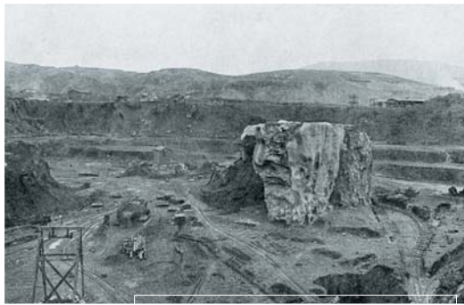
Parcocha meatzea XX. mendearen hasieran Mina Parcocha a principios del siglo XX

XIX. mendearen amaieran, lehergailuak erabiltzen hasi ziren burdina-minerala aire zabalean erazteko. Hori dela-eta, hainbat lekutan maila freatikoraino iristen zen eta orduan ura xukatu behar izaten zuten, ponpen bidez, lanean jarraitu ahal izateko. Meatzaritza-ustiapena uztean, lurpeko ura azaleratu egin zen eta hainbat putzu sortu ziren, La Arboledakoak esate baterako: Hosti6n, Blondis eta Parkotxa.