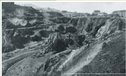
Mame, Carmen eta Orconera meatzeak XX. mendearen hasieran. Atzealdean, La Arboleda Minas Mame, Carmen y Orconera a principios del siglo XX. Al fondo, La Arboleda