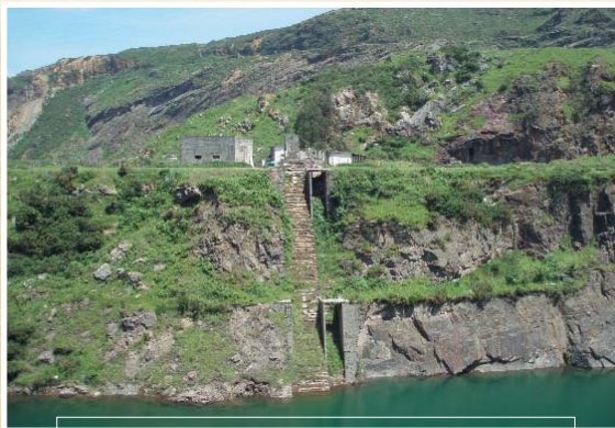
Plano inklinatua eta meatze-instalazioak Blondis putzuan Plano inclinado e instalaciones mineras en el Pozo Blondis

Parkotxa putzua Barrionuevoren azpian dago, eta bertan zeuden Parkotxa eta Uni3n meatzeak. XX. mendeko 70eko hamarkadan Larreineta mineral-ikuztegiko lohiak botatzeko erabili zuten, eta horregatik du kolore marroia.