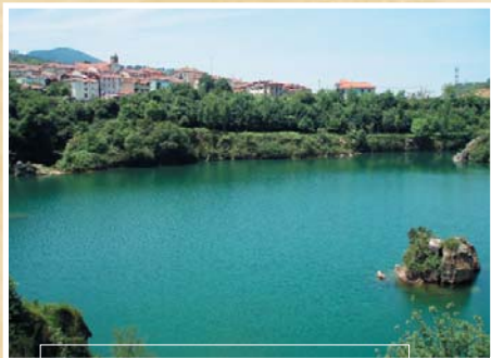
Hostión putzua, La Arboledaren ondoan Pozo Hostión, junto a La Arboleda

K.o. I. mendean, Plinio “Zaharrak” Kantauri itsasoaren ondoan guztiz burdinazkoa zen mendi bat zegoela esan zuen; La Arboleda eta Barri-nuevoren artekoa, hain zuzen ere, horrelakoa zen. Mendi hori desagertu egin zen, burdina aire zabalean erazi baitzuten, batez ere 1876-1930 aldian. Hala ere, joan den mendeko 80ko hamarkadaraino eutsi zitzaion bertan meatzaritza-jarduerari.