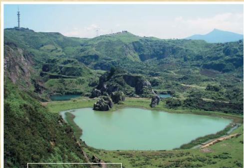
Pozo Parkotxa putzua

A finales del siglo XIX se empezaron a utilizar los explosivos para la extracci6n a cielo abierto del mineral de hierro. Debido a esto, en algunas zonas se alcanzaba el nivel freático y cuando esto ocurría había que achicar el agua con bombas para poder seguir trabajando. Al abandonarse la explotaci6n minera, el agua subterránea aflor6 a la superficie y se formaron pozos como los de La Arboleda: Hosti6n, Blondis y Parkotxa.