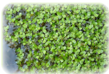
FIGURAS Y MEDIDAS DE PROTECCIÓN

subterráneo de Barazar, por otro. Este humedal interior tiene un gran valor en el mantenimiento de comunidades vegetales y faunísticas ligadas al agua, especialmente como zona de refugio y alimentación de aves acuáticas en sus pasos migratorios.