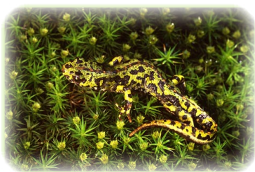
FIGURA ETA NEURRI BABESLEAK

fauna ugari izatea ahalbidetzen dute: esate baterako, amuarraina, ezkailua, uhandre palmatua edo suge gorbataduna. Landarediak babesturik, ur-zozoa eta uretxoria elikagaiak bilatzen ahalegintzen dira. Ibarra arian-arian zabaldu egiten da Espejorako antzinako erromatar bidearen ondotik; hemen zubi eder batek gurutzatzen du azken zatian urak isurtzera Ebrorantz bideratutako Omecillo ibaia.