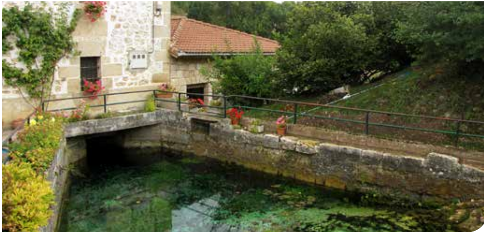
Aspecto del manantial de Peñacerrada.