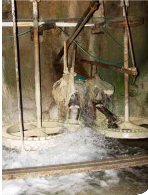
Aspecto del manantial tras vaciado para poner en marcha los molinos. Molinos de la panadería de Peñacerrada.