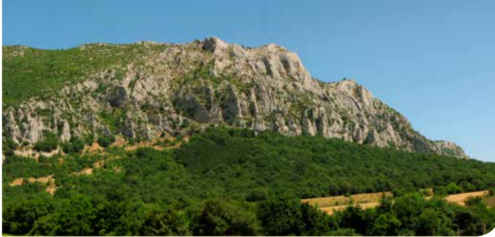
Aspecto general de las Calizas de Egin y la Cueva Leze.