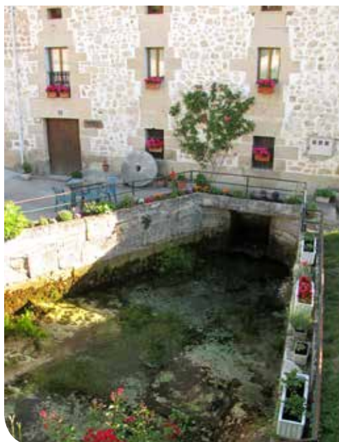
Iturburuaren itxura, errotak martxan jartzeko hustu ondoren.