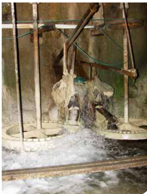
Urizaharreko okindegiko errotak.